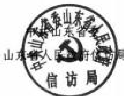
山东省人民政府信访局