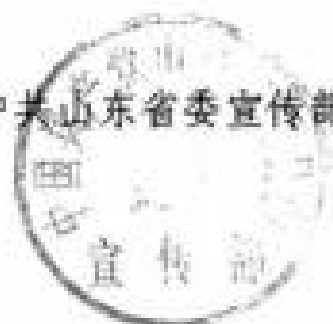
中共山东省委宣传部