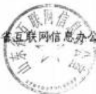
山东省互联网信息办公室